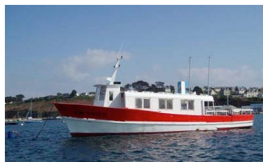
Reine d'Armor (Camaret)