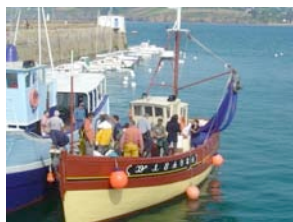
Reine de l'Arvor (Douarnenez)

Une parade de ces bateaux sera organisée en fin de journée le dimanche 25 juillet à l'ouverture de la porte du bassin à flots.