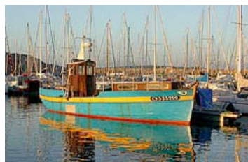
La Fauvette (Morgat)