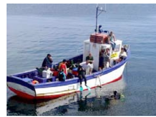
Bass Loch (Audierne)